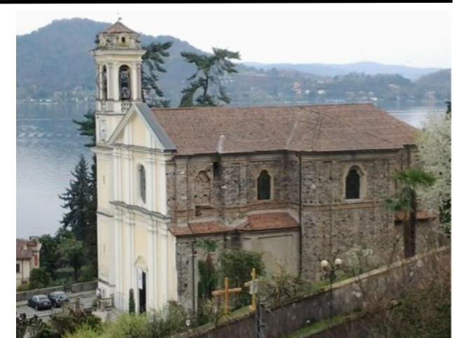
Chiesa di S. Margherita

Partenza da S. Caterina per Arona alle 17:50, arrivo alle 18:50.